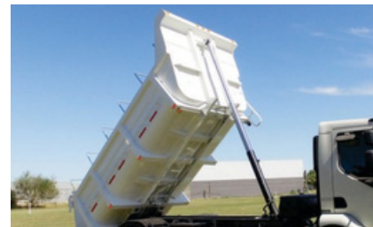
Cilindro hidráulico de 3 etapas.