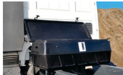
Cajón de herramientas frontal.